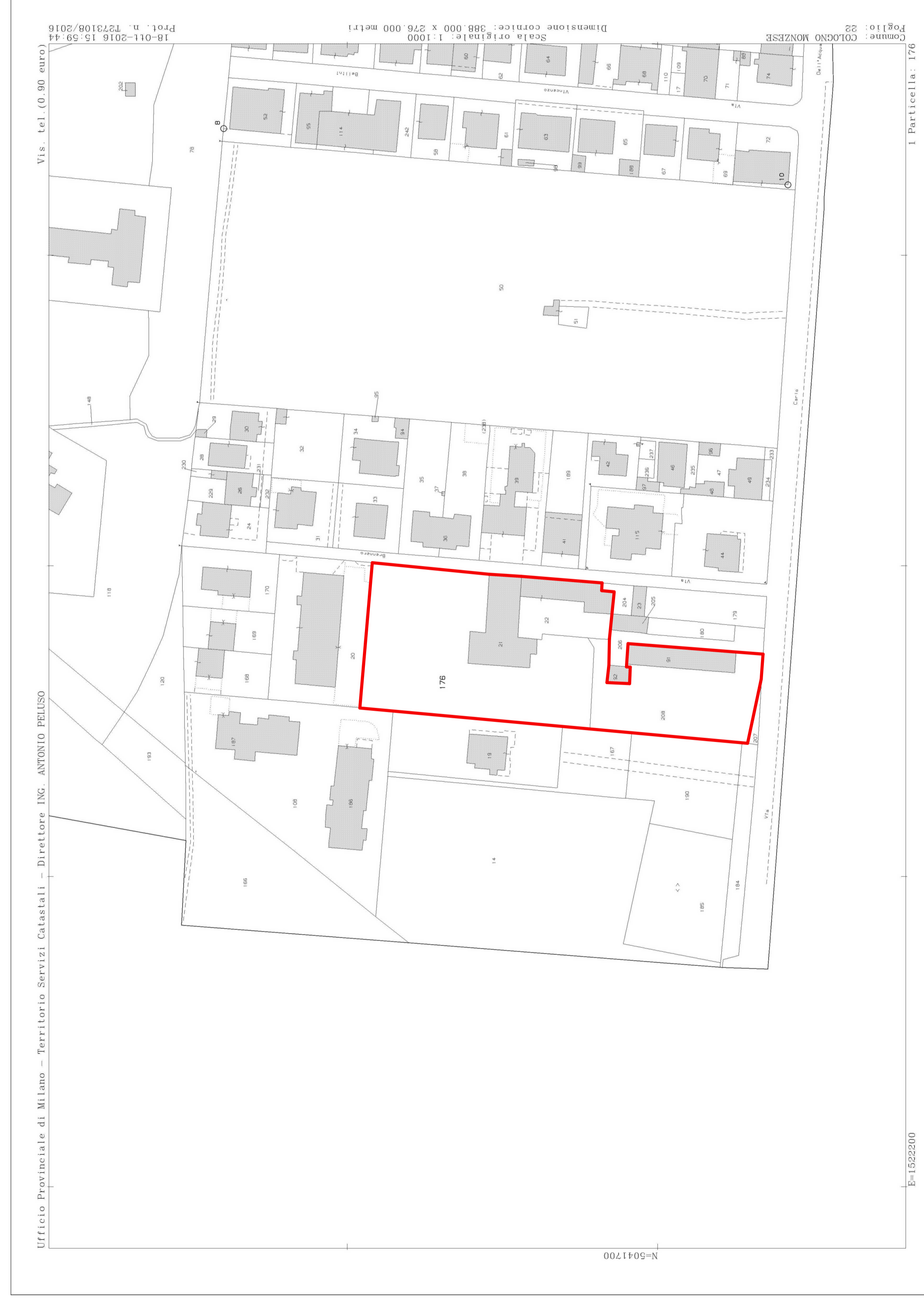
ESTRATTO DI MAPPA - RAPP. 1/1000 - FOGLIO 22